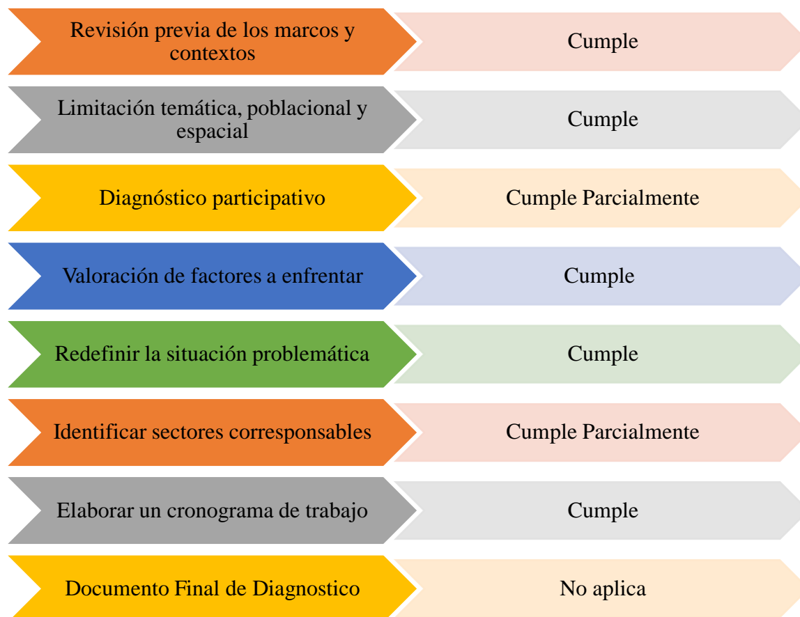
Figura 3. Lista de Chequeo Diagnóstico Preliminar de la Política Pública de Legalización de Asentamientos Humanos

Como actividad final, dentro del componente de apoyo en el desarrollo de las Políticas Públicas, se realiza la revisión y actualización del imperativo legal correspondiente a la Política Pública de Legalización de Asentamientos Humanos en proceso de diagnóstico previo, para tal propósito se estable la matriz de marco normativo cuyos componentes son: